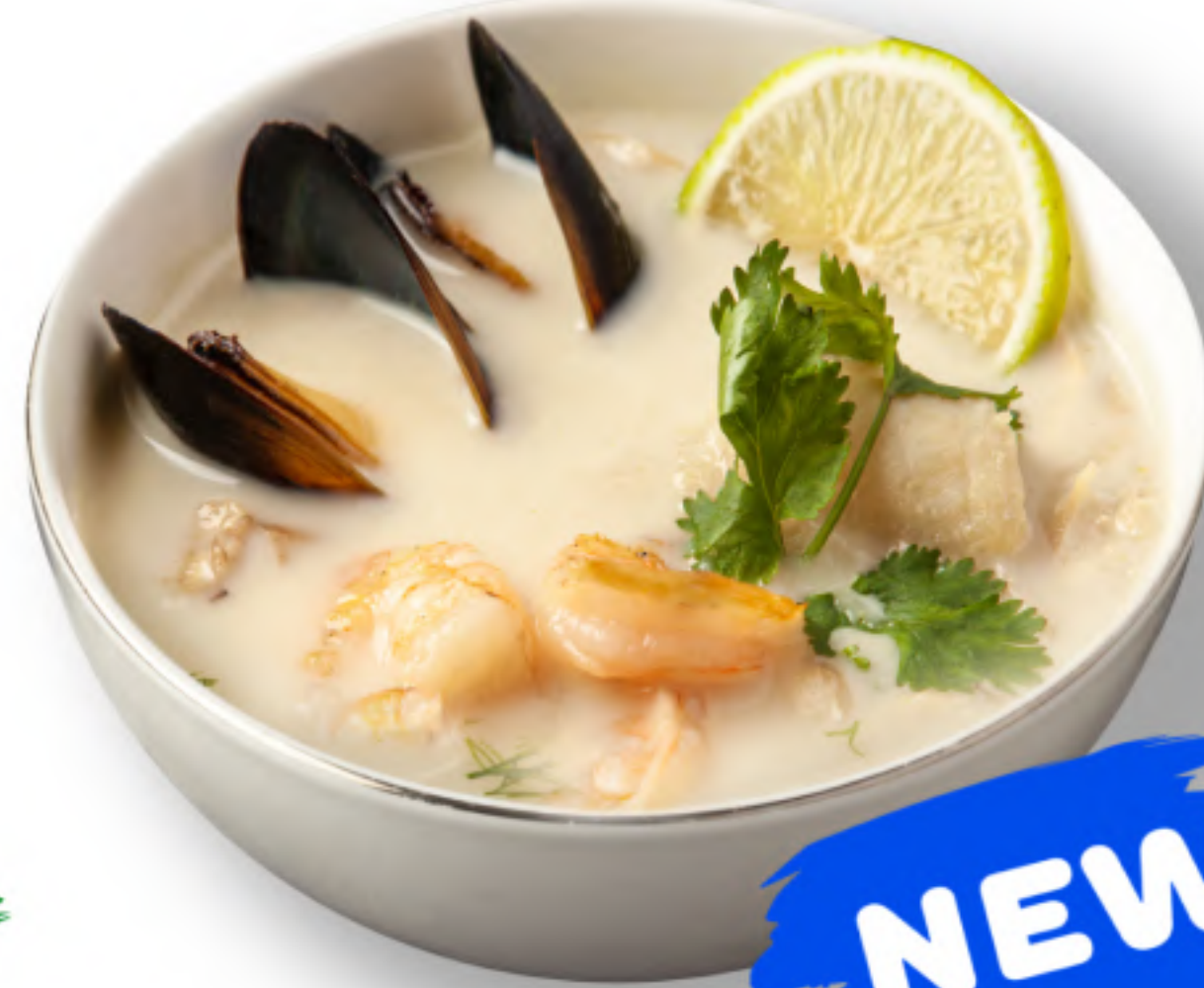
ПСАРОСУПА 390 ТРАДИЦИОННЫЙ РЫБНЫЙ СУП кальмары, креветки, мидии, грибы, лайм, имбирь, кинза, кокосовое молоко (400мл.) NEW