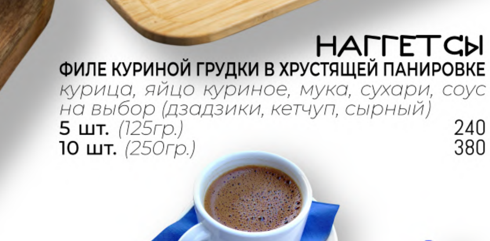
НАГГЕТСЫ 240 ФИЛЕ КУРИНОЙ ГРУДКИ В ХРУСТЯЩЕЙ ПАНИРОВКЕ курица, яйцо куриное, мука, сухари, соус на выбор (дзадзики, кетчуп, сырный) 380 5 шт. (125гр.) 10 шт. (250гр.)