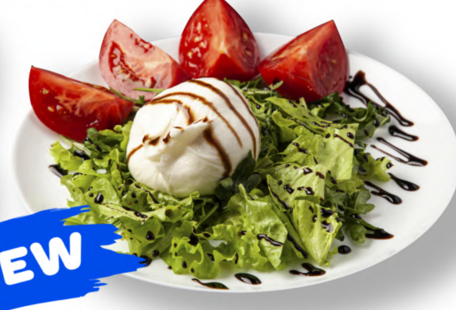
БУРРАТАСАЛАТА 695 САЛАТ С СЫРОМ БУРРАТА сыр буррата, помидоры, руккола, листья салата, бальзамический соус, оливковое масло (250гр.) NEW