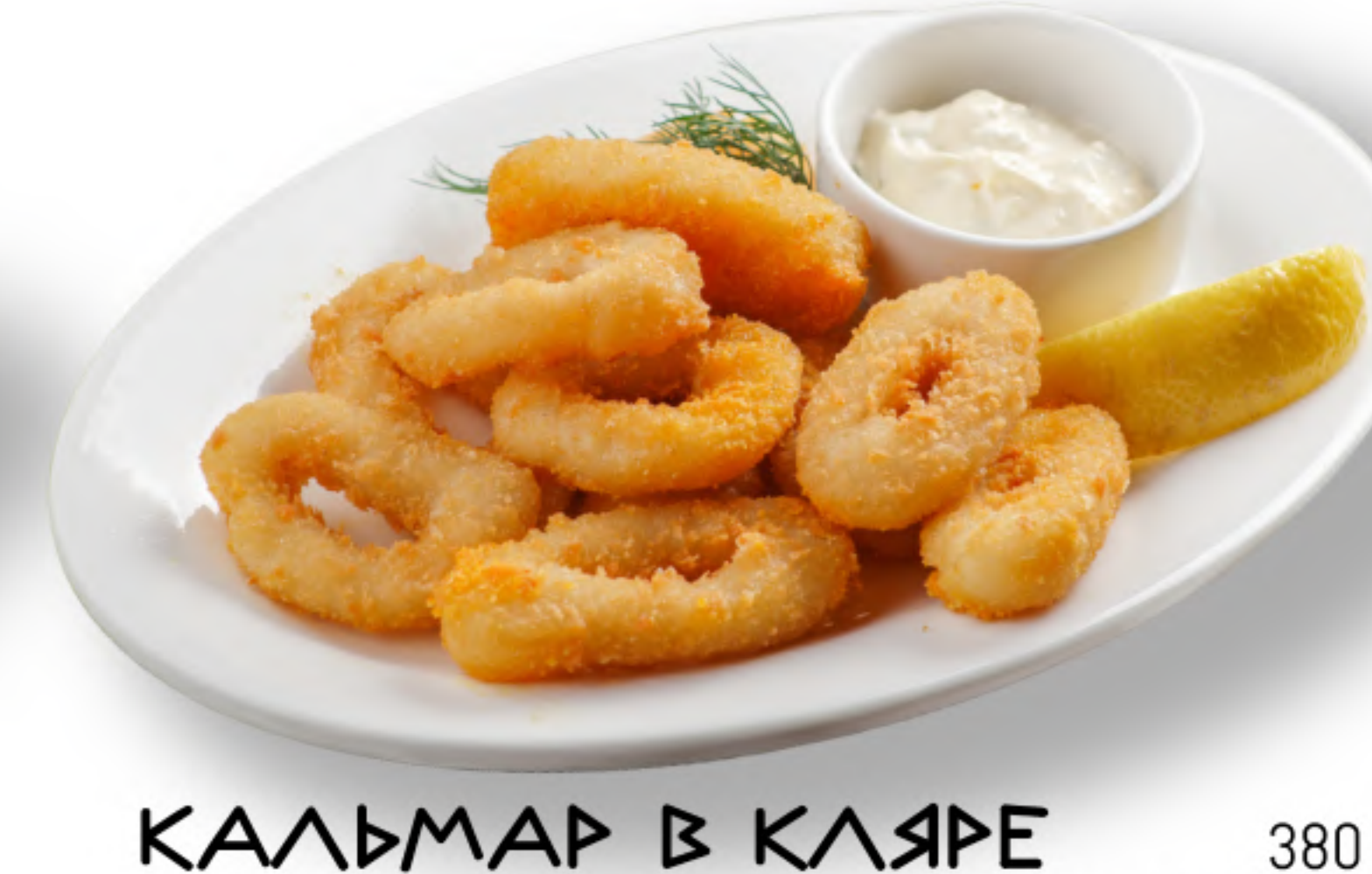
КАЛЬМАР В КЛЯРЕ 380 кальмар, яйцо куриное, лимон, сухари, мука, перец, соль, соус дзадзики (200гр.)