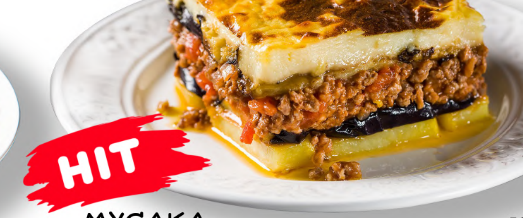
МУСАКА 590 ТРАДИЦИОННАЯ ГРЕЧЕСКАЯ ЗАПЕКАНКА говяжий фарш, баклажан, кабачок, картофель, красный лук, зелень, сыр, соус бешамель (молоко, мука, сливочное масло, куриное яйцо, мускатный орех) (350гр.) HIT