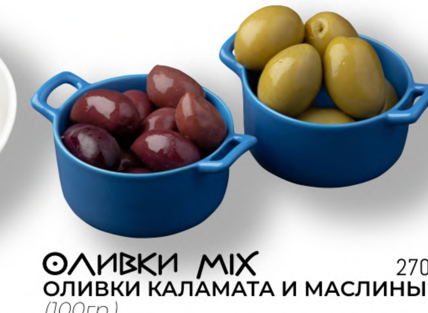
ОЛИВКИ МІХ 270 ОЛИВКИ КАЛАМАТА И МАСЛИНЫ (100гр.)