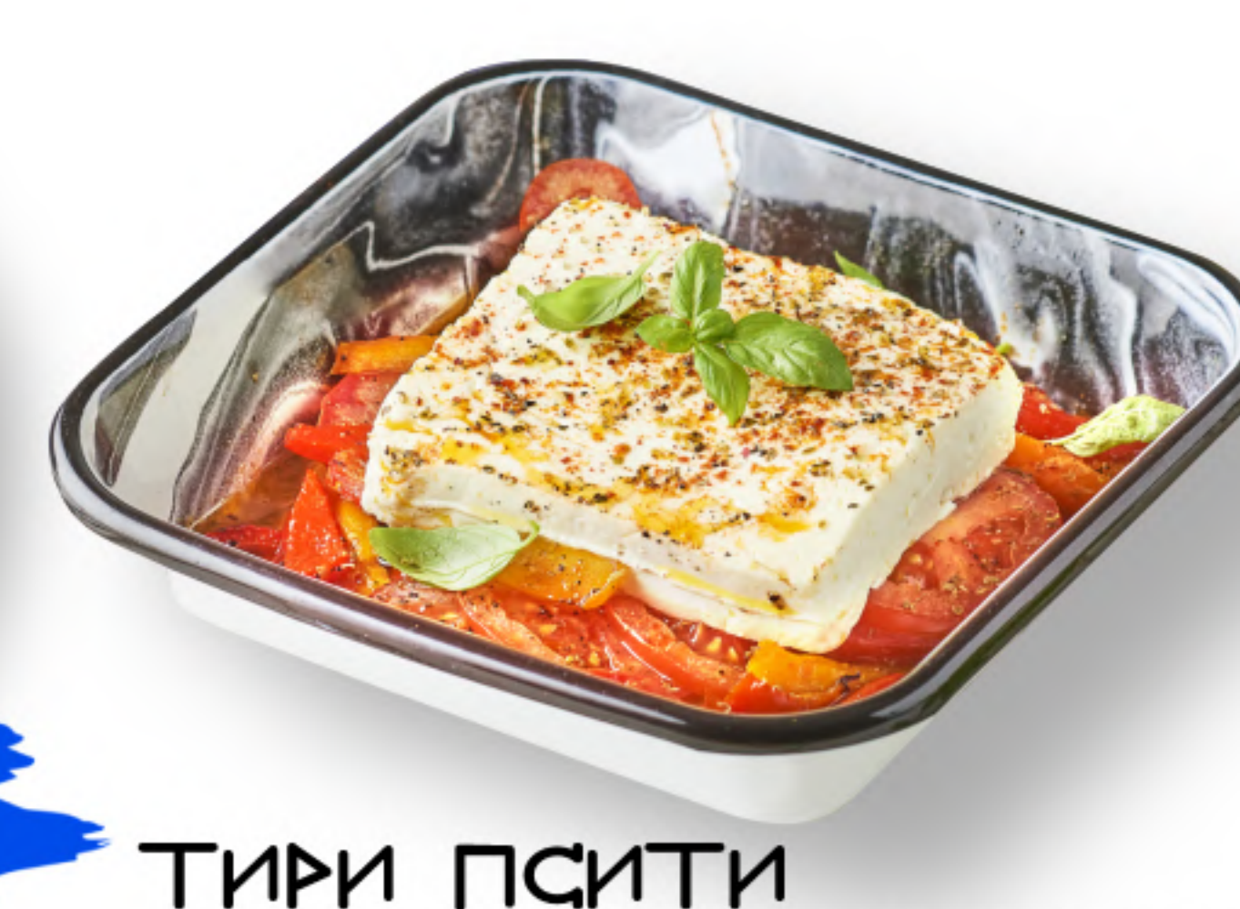
ТИРИ ПСИТИ 390 ПОМИДОРЫ, СЫР, ОЛИВКОВОЕ МАСЛО, ОРЕГАНО ФЕТА ПСИТИ (100гр.) 450 ХАЛУМИ ПСИТИ (100гр.)