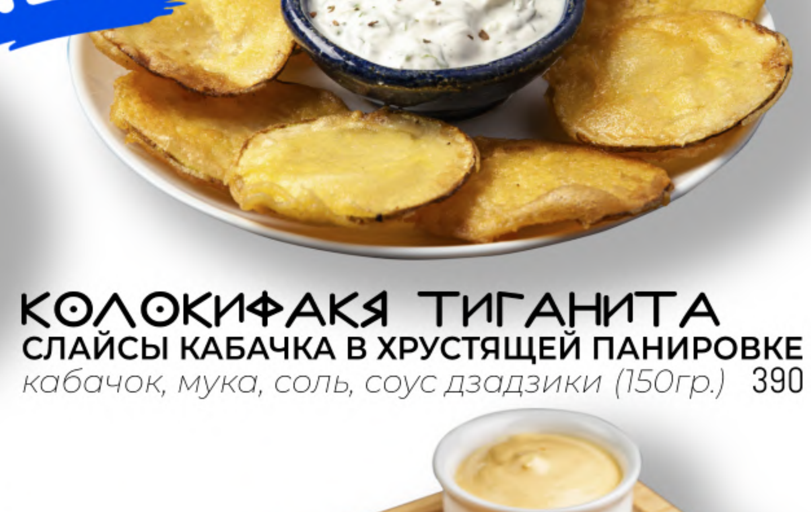
КОЛОКИФАКЯ ТИГАНИТА 390 СЛАЙСЫ КАБАЧКА В ХРУСТЯЩЕЙ ПАНИРОВКЕ кабачок, мука, соль, соус дзадзики (150гр.)