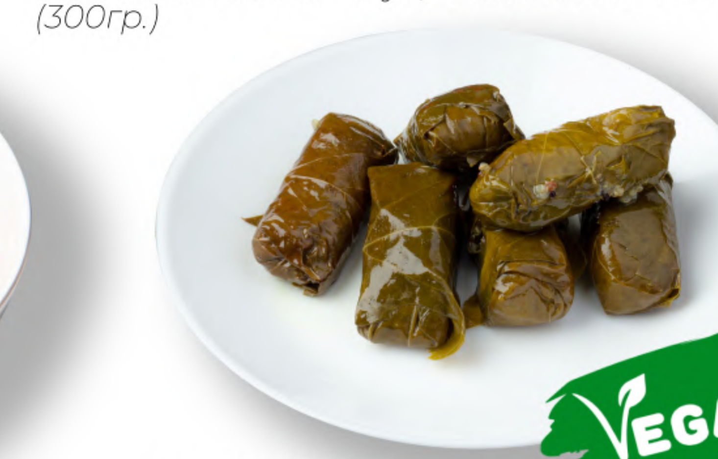
ДОЛМАДЕС 460 молодые виноградные листья, рис или киноа с приправами из укропа и мяты С КИНОА (200гр.) 460 С РИСОМ (280гр.) 400 VEGAN