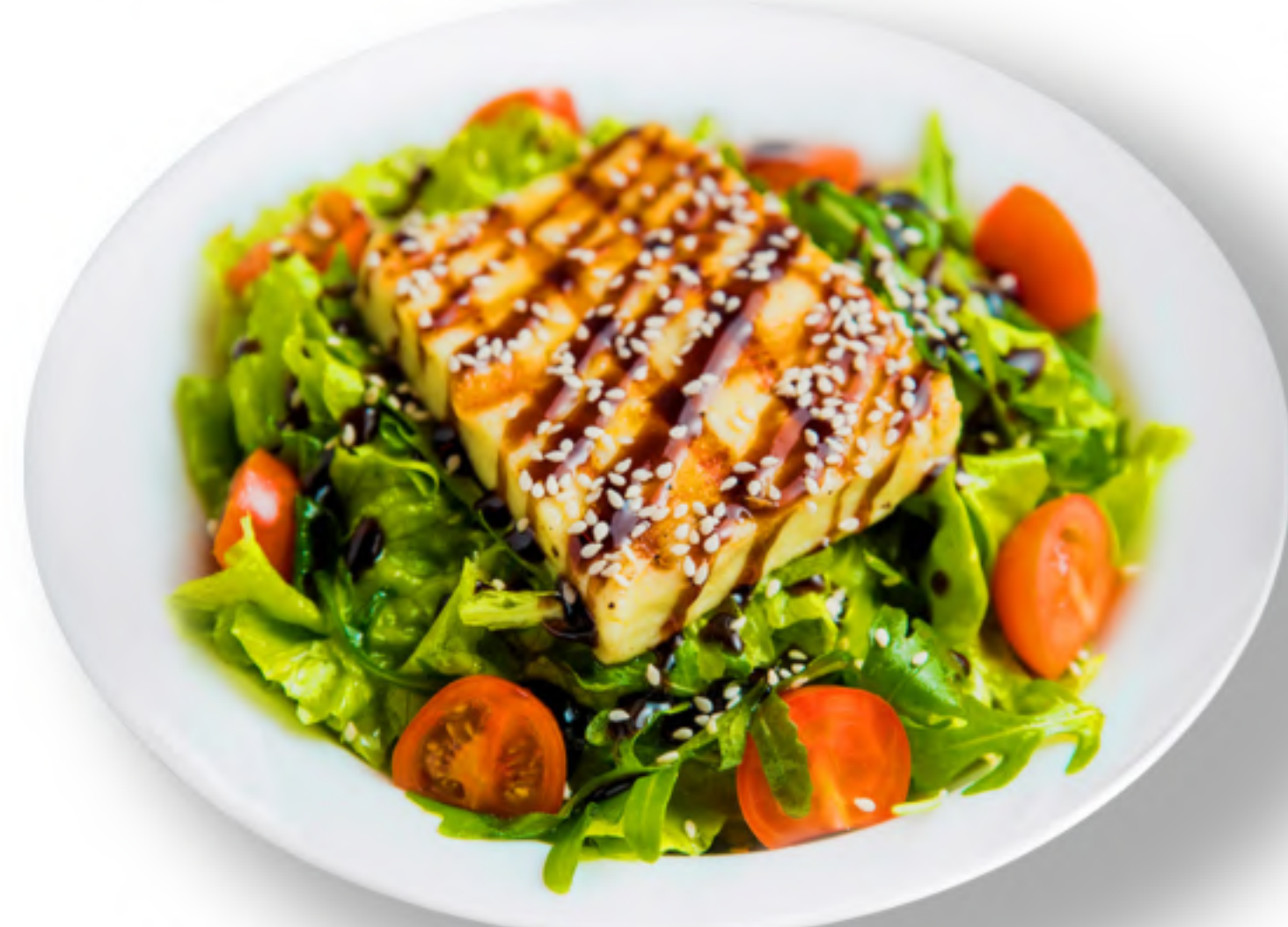
МИЛОС 440 АВТОРСКИЙ САЛАТ сыр халуми, помидоры черри, руккола, листья салата, кунжут, бальзамический соус, оливковое масло (300гр.) С СУВЛАКИ ИЗ КУРИЦЫ +100 С КРЕВЕТКАМИ +120