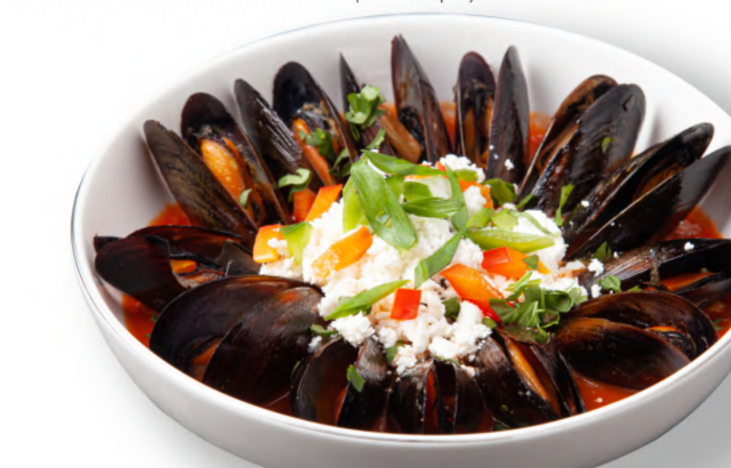
МИДИИ САГАНАКИ 540 МИДИИ В ГРЕЧЕСКОМ СОУСЕ САГАНАКИ мидии, сыр фета, помидоры, болгарский перец, лук, орегано, соль, сладкая гочица, оливковое масло (420гр.) HIT