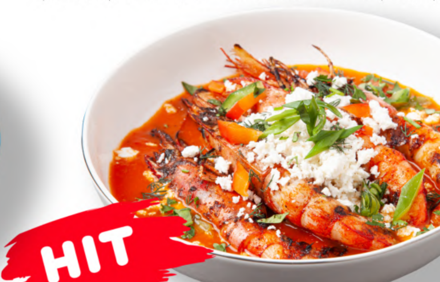
КРЕВЕТКИ САГАНАКИ 580 ЛАНГУСТИНЫ В ГРЕЧЕСКОМ СОУСЕ САГАНАКИ лангустины, сыр фета, помидоры, болгарский перец, лук, орегано, соль, сладкая гочица, оливковое масло (450гр.) HIT