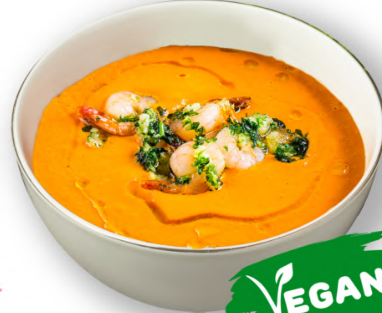
КОЛОКИДА 290 ТЫКВЕННЫЙ СУП-ПЮРЕ тыква, морковь, картофель, перец, лук, соль, оливковое масло (250мл.) VEGAN