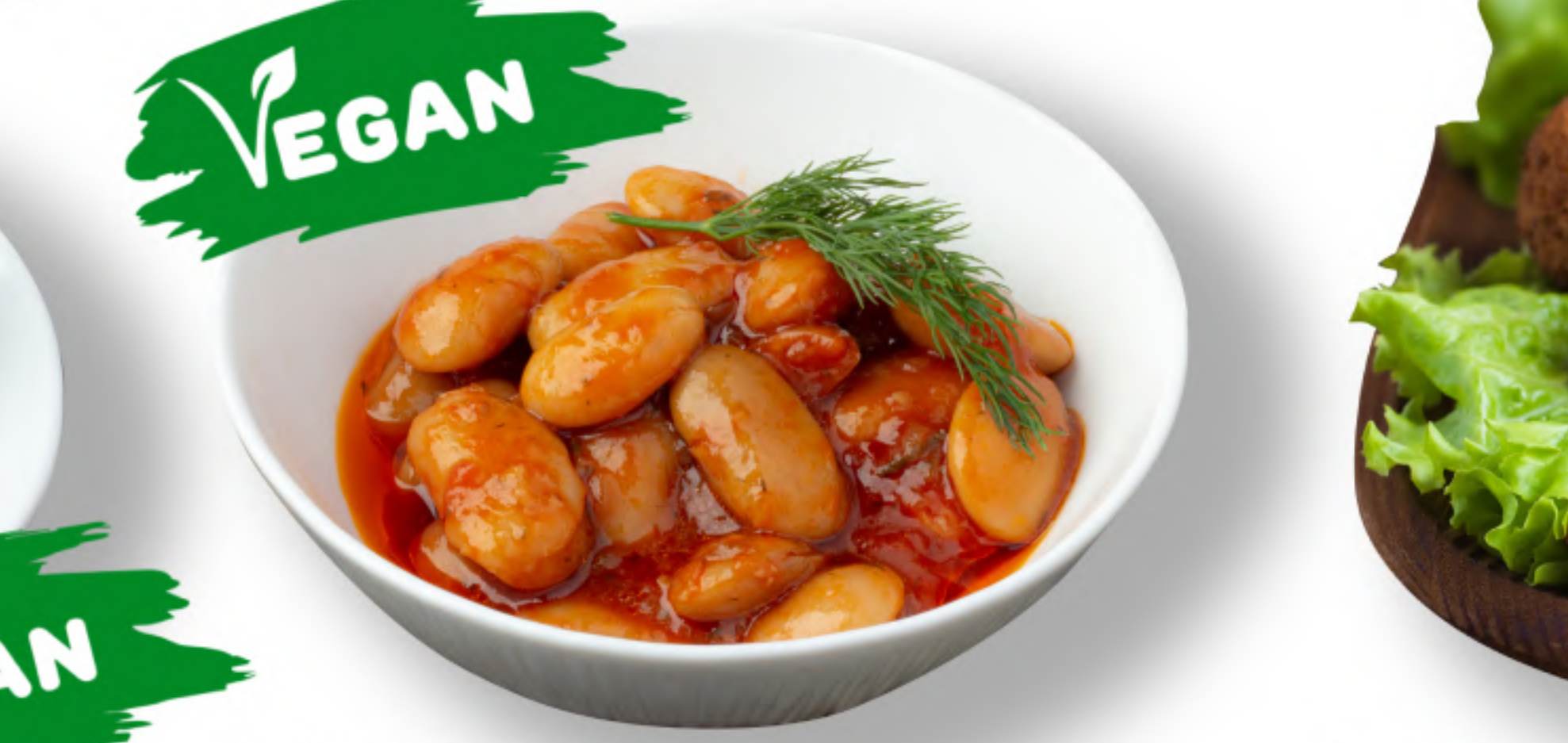
ФАСОЛЯ 420 ГИГАНТСКАЯ ФАСОЛЯ, ПЕЧЕНАЯ В ТОМАТНОМ СОУСЕ (280гр.) VEGAN