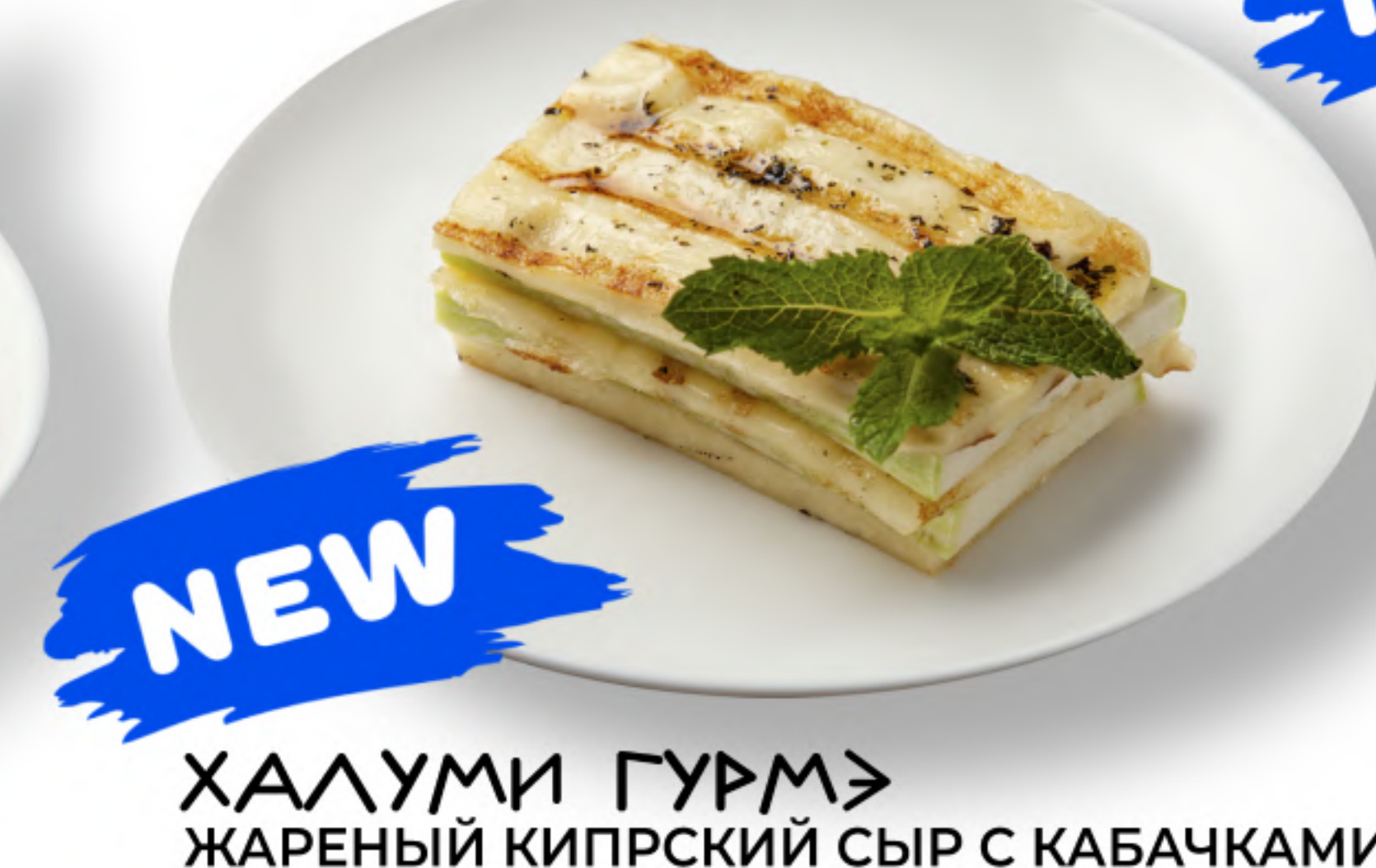
ХАЛУМИ ГУРМ 550/850 ЖАРЕННЫЙ КИПРСКИЙ СЫР С КАБАЧКАМИ кипрский сыр халуми, кабачок, мята, оливковое масло NEW