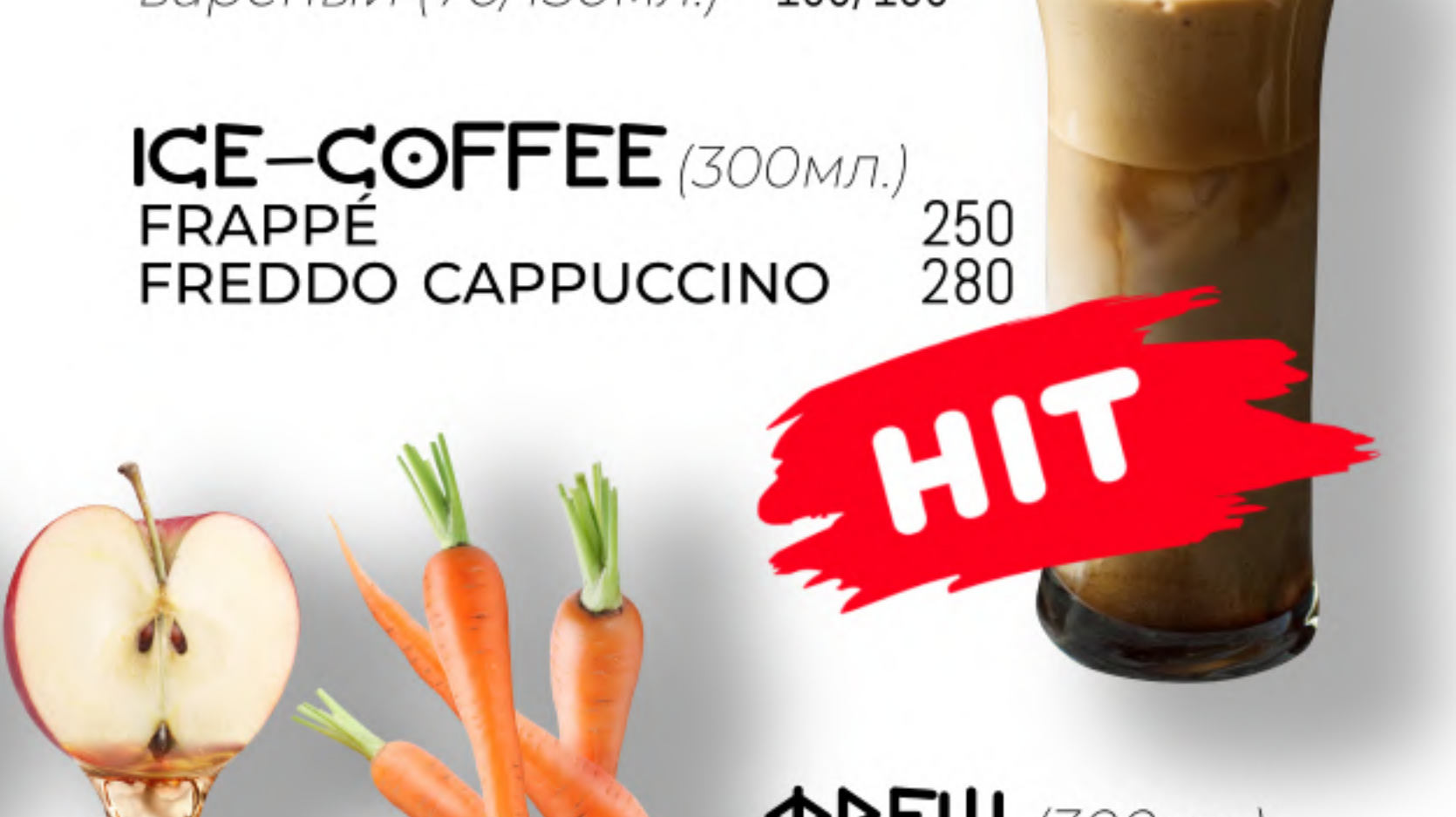
ГРЕЧЕСКИЙ КОФЕ 130/190 вареный (70/150мл.)