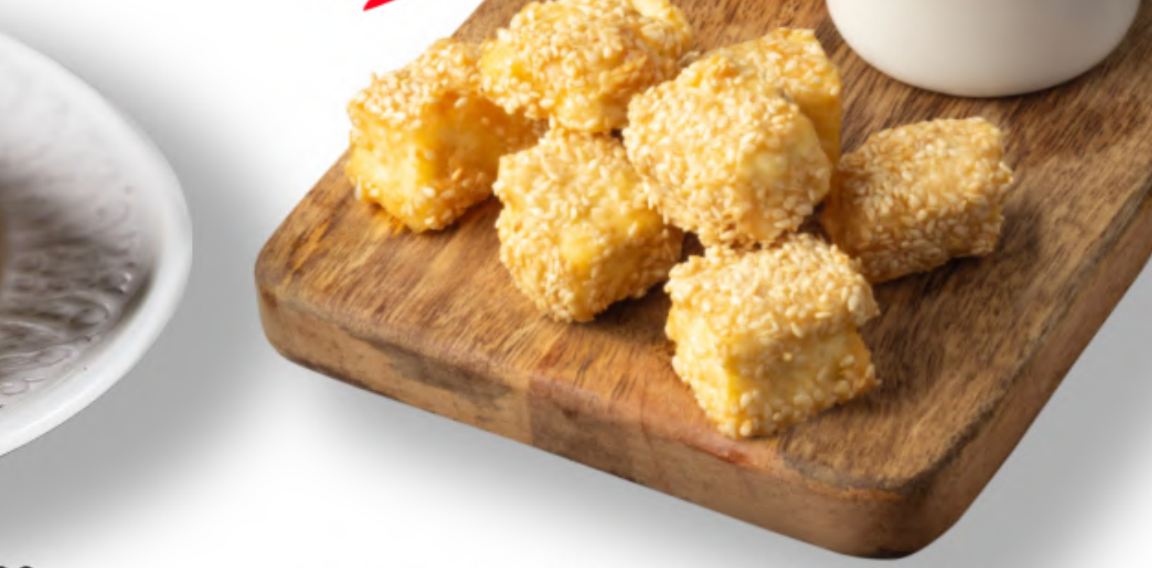
ТИРИ МЭ СУСАМИ 440 сыр, яйцо куриное, мука, кунжут, мед ФЕТА МЭ СУСАМИ (200гр.) 470 ХАЛУМИ МЭ СУСАМИ (200гр.)