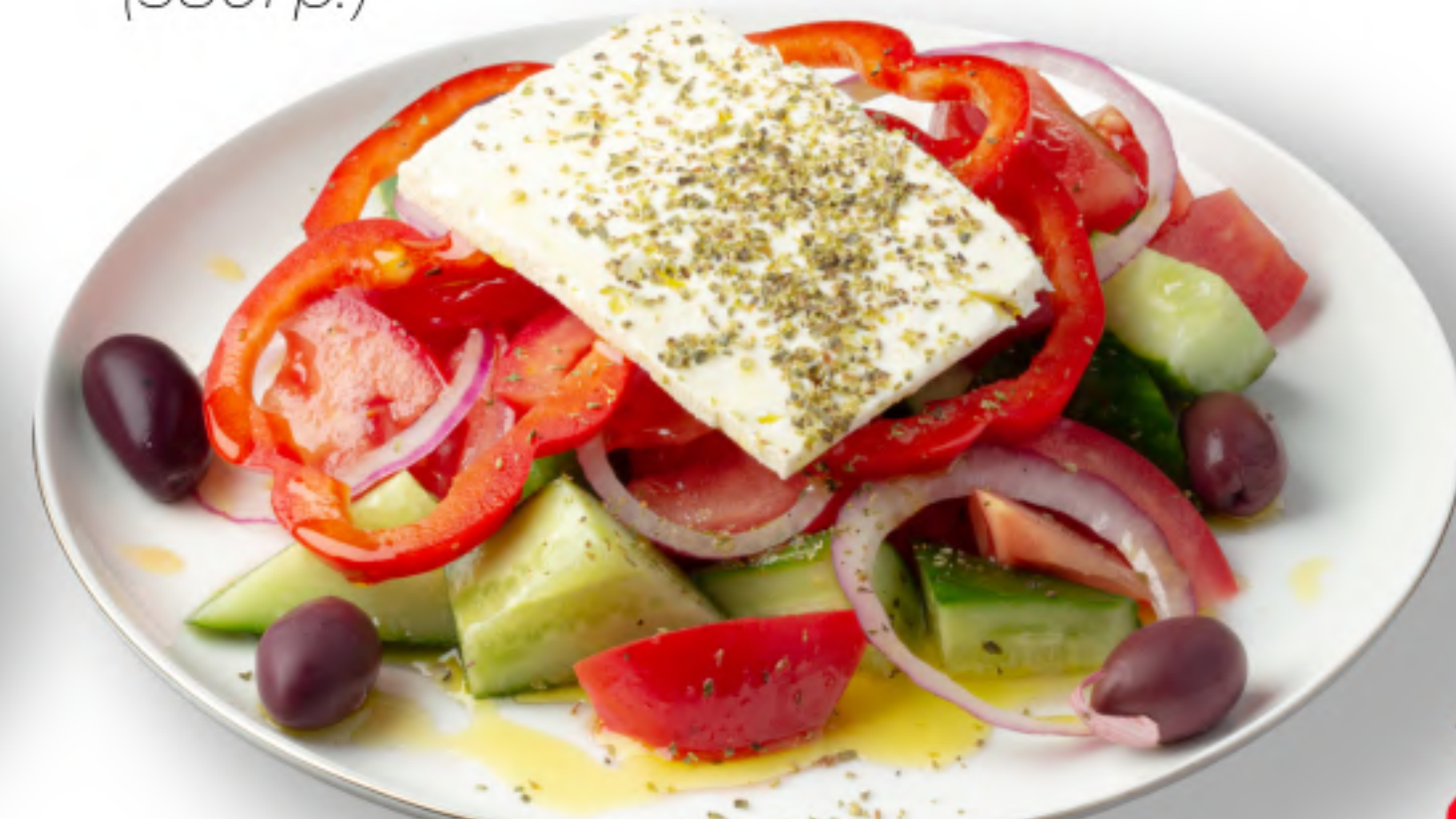
ХОРЬЯТИКИ 470 ТРАДИЦИОННЫЙ ГРЕЧЕСКИЙ САЛАТ помидоры, огурцы, болгарский перец, оливки каламата, красный лук, сыр фета, орегано, оливковое масло (400гр.)