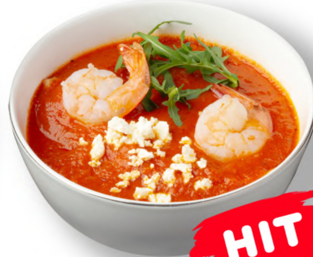
ДОМАТО 290 ТРАДИЦИОННЫЙ ТОМАТНЫЙ СУП помидоры, лук, зелень, перец, соль, оливковое масло (250мл.) HIT