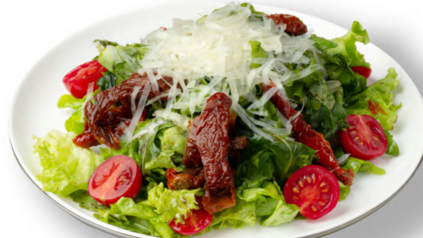
РОКА МАРУЛИ 430 САЛАТ С ВЯЛЕННЫМИ ТОМАТАМИ помидоры черри, вяленые томаты, руккола, листья салата, сыр пармезан, оливковое масло (200гр.)