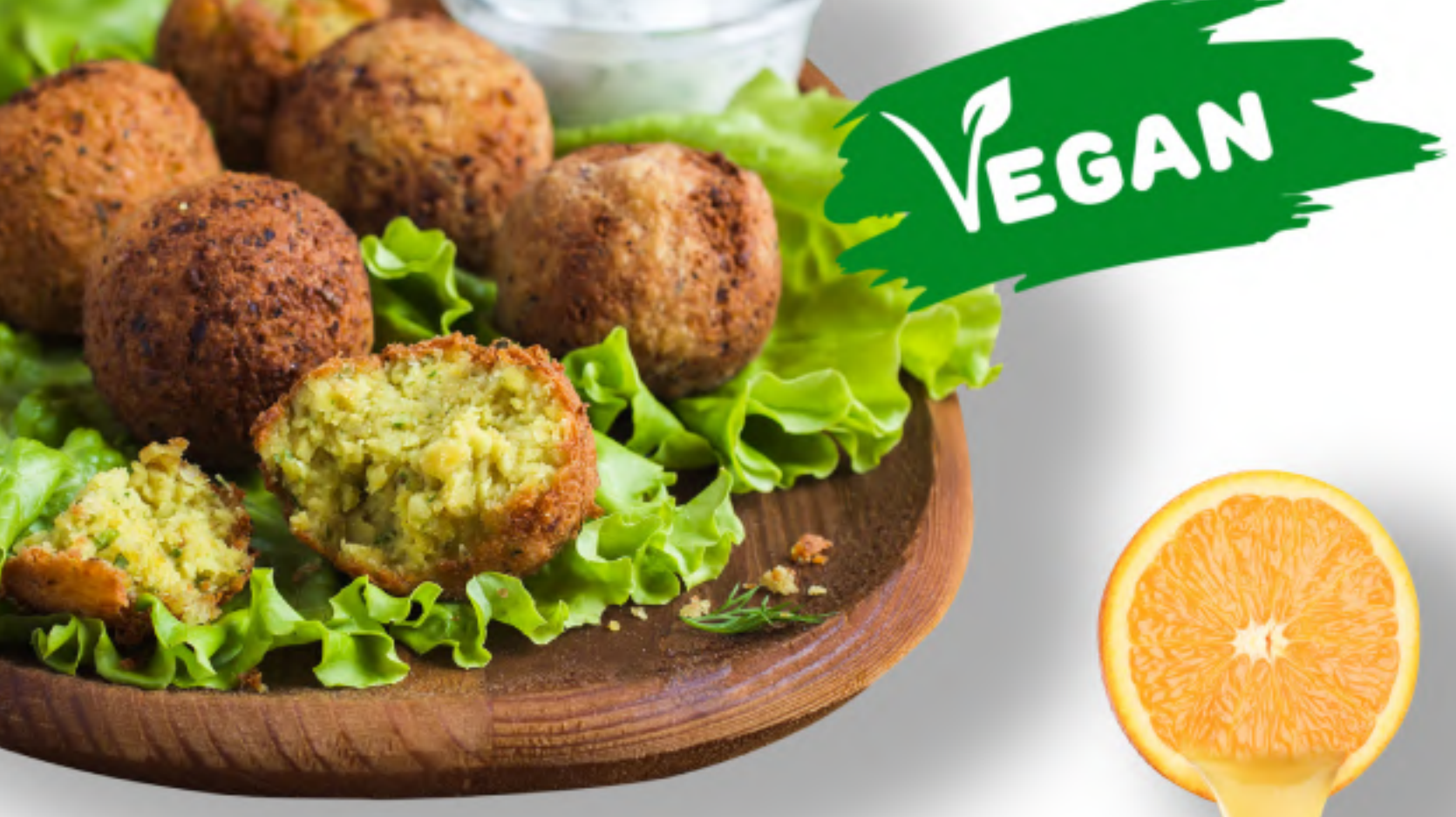
ФАЛАФЕЛЬ 200 ЖАРЕННЫЕ ВО ФРИТЮРЕ ШАРИКИ ИЗ НУТА нут, чеснок, укроп, соль, перец, соус на выбор (дзадзики, кетчуп, сырный) 350 3 шт. (90гр.) 6 шт. (180гр.) VEGAN