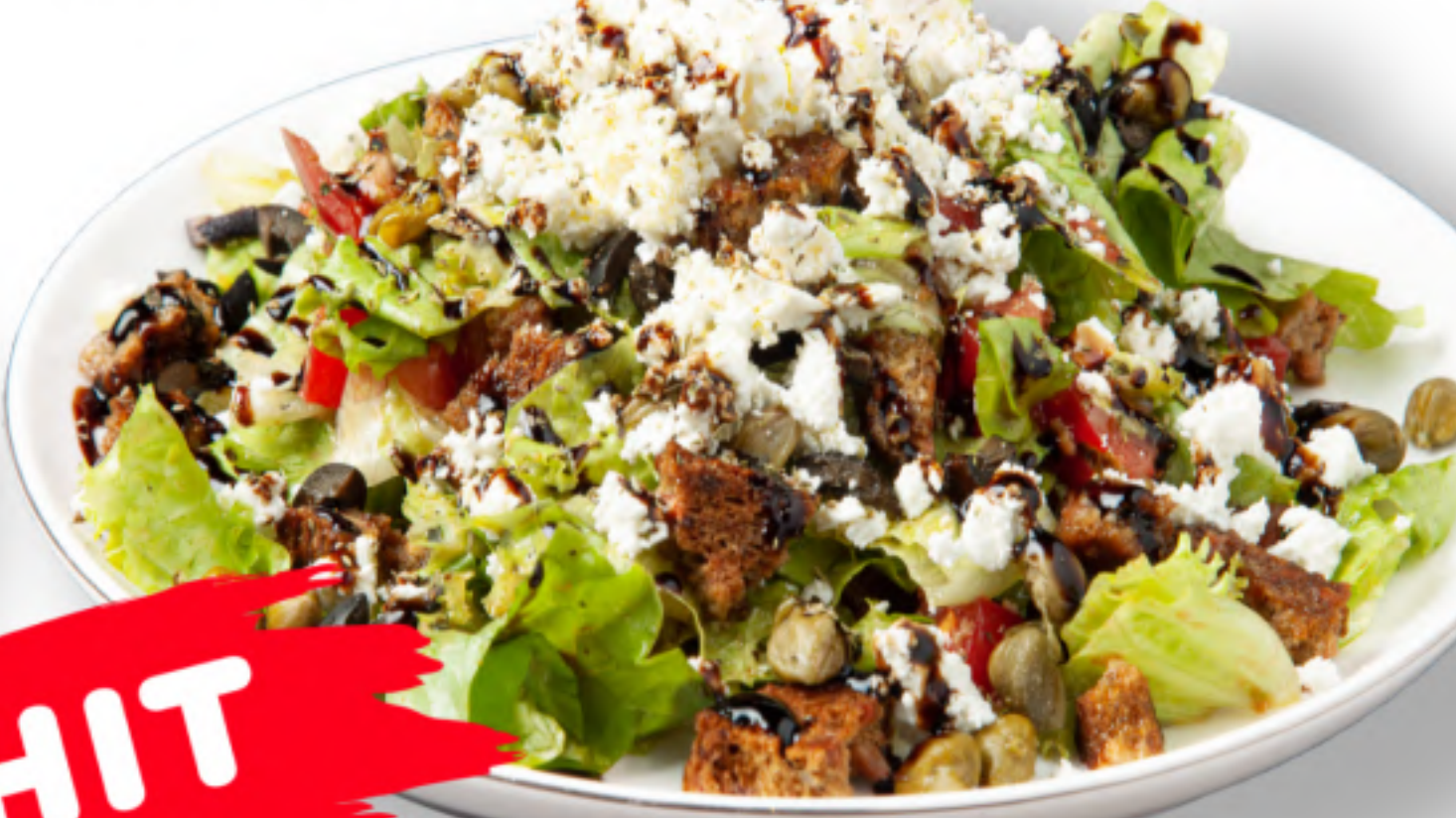
ДАКОС 520 КРИТСКИЙ САЛАТ помидоры, листья салата, каперсы, сыр фета, оливки каламата, сухарики, орегано, бальзамический соус, оливковое масло (300гр.) HIT