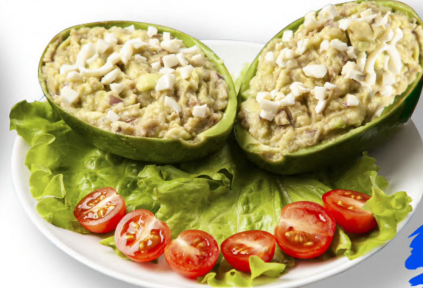
АВОКАДО 460 ФАРШИРОВАННОЕ АВОКАДО авокадо, тунец, куриное яйцо, красный лук, чернослив, горчица, лимонный сок (380гр.)