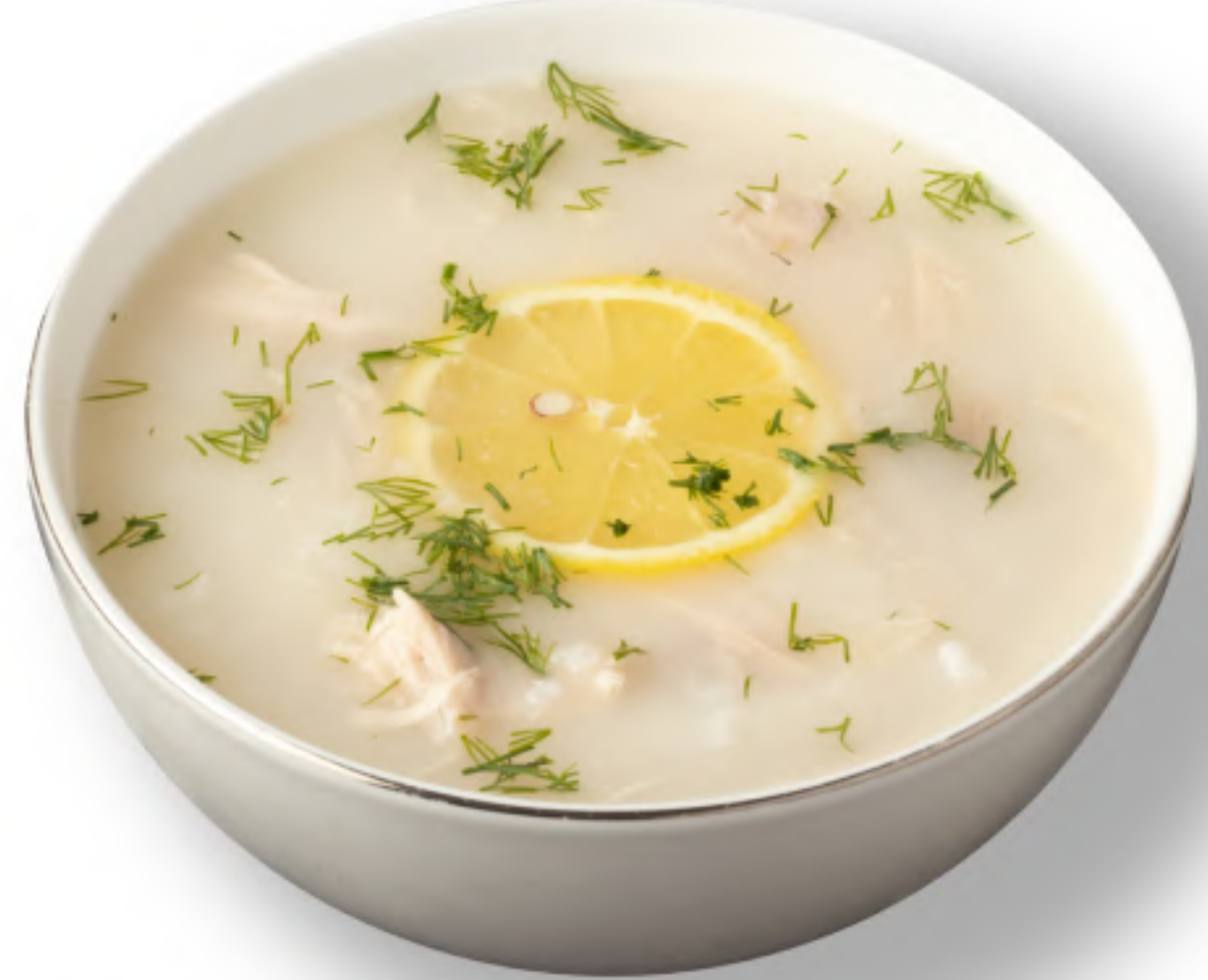
АВГОЛЕМОНО 290 ТРАДИЦИОННЫЙ КУРИНЫЙ СУП курица, рис, куриное яйцо, лимон, перец, соль (250мл.)