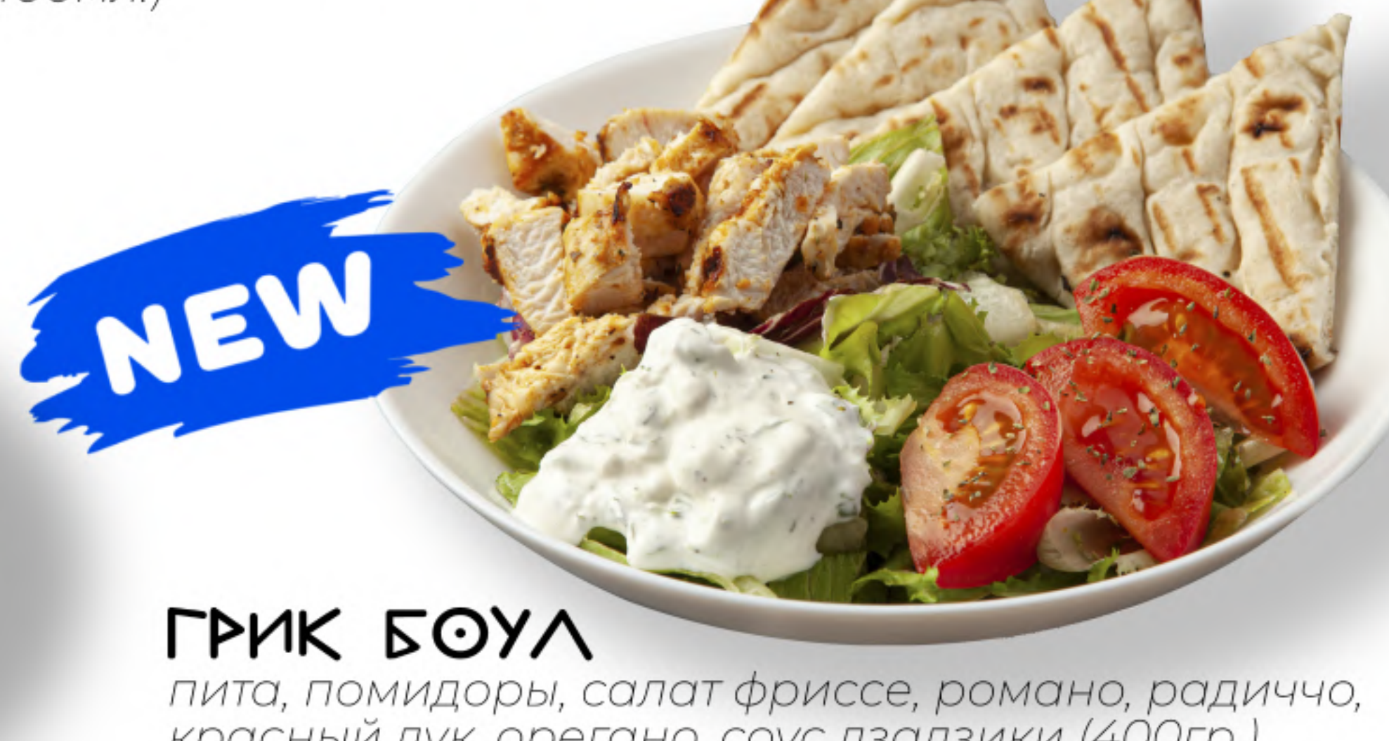
ГРИК БОУЛ пита, помидоры, салат фриссе, романо, радиччо, красный лук, орегано, соус дзадзики (400гр.) NEW